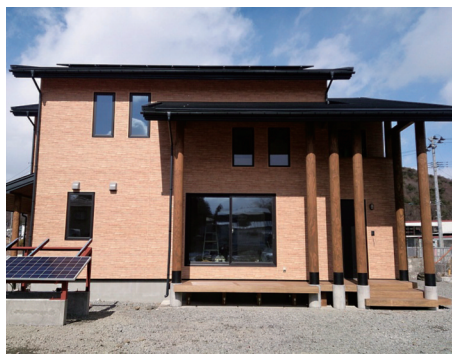
丸太を生かした外観デザイン